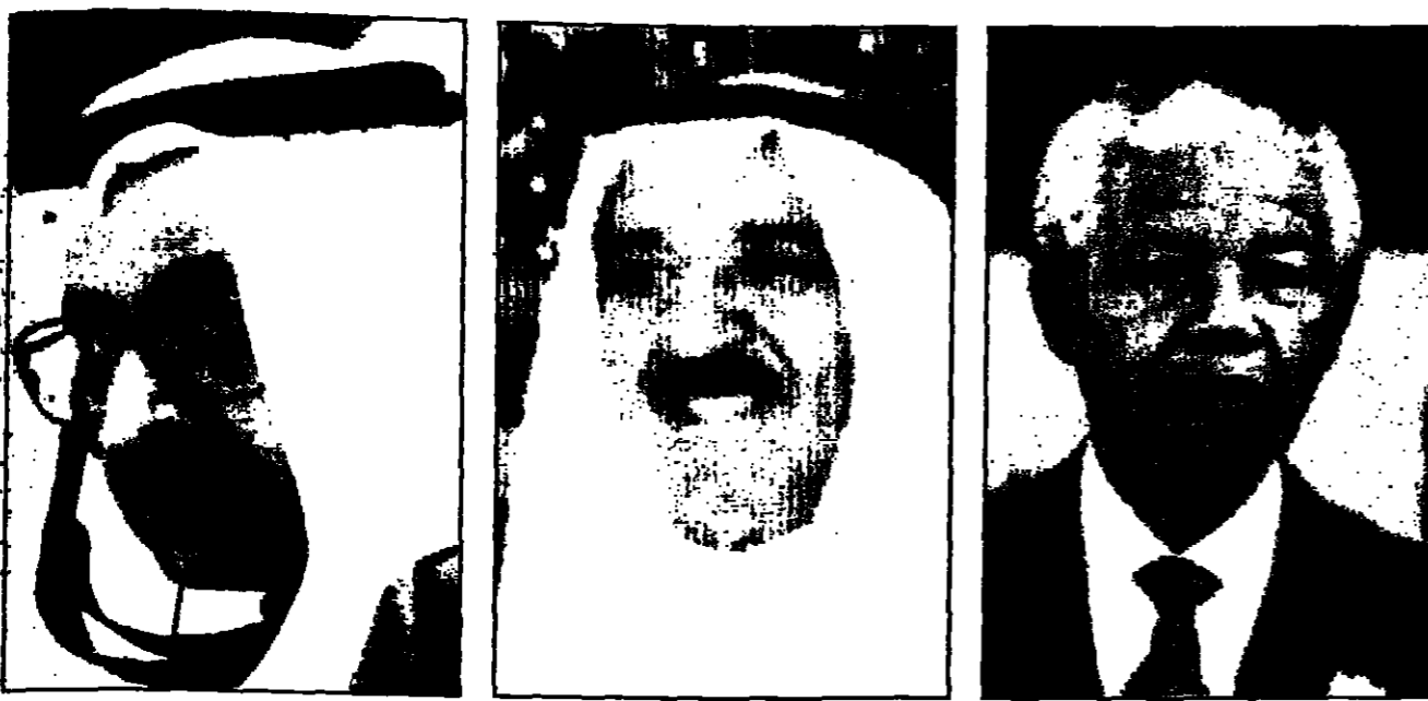
الشيخ سالم الصباح